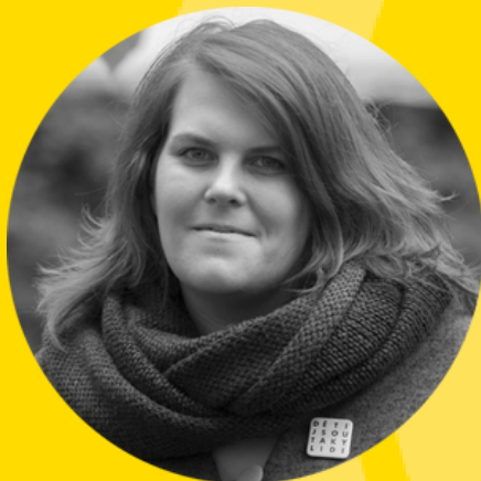
Vedoucí projektů a poradenského centra: